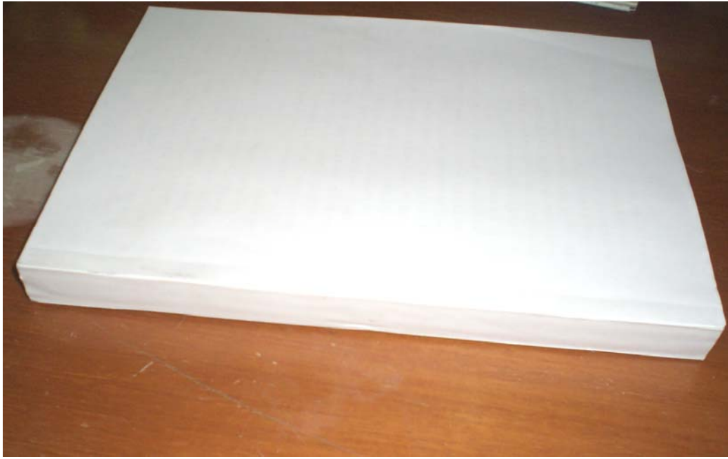
(注：上图为正确的封底格式)